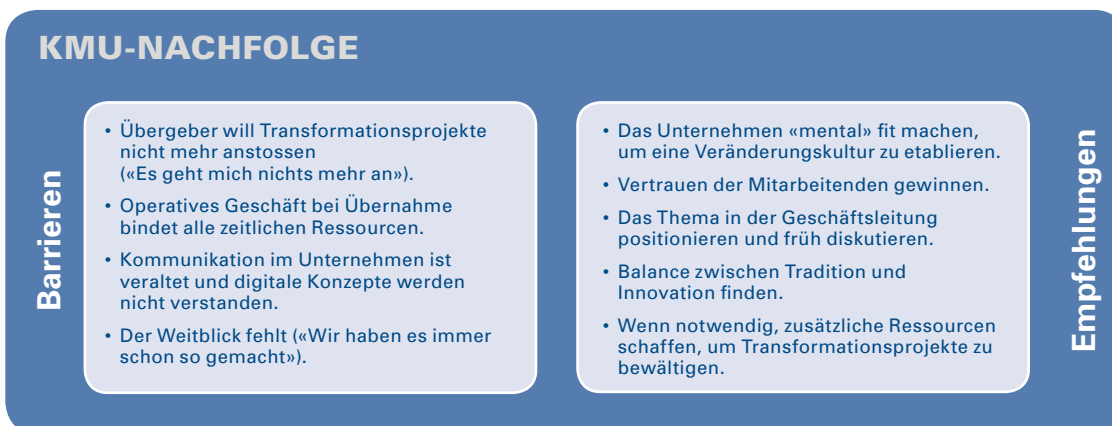
Illustration 3: Barrieren und Empfehlungen für die KMU-Nachfolge (eigene Darstellung)

Es gilt, die Treiber der Digitalisierung zu verstehen, Barrieren abzubauen oder zu umgehen und den Führungsaufgaben nachzukommen. Speziell bei der KMU-Nachfolge sind die Barrieren bekannt und entsprechende Empfehlungen liegen vor.